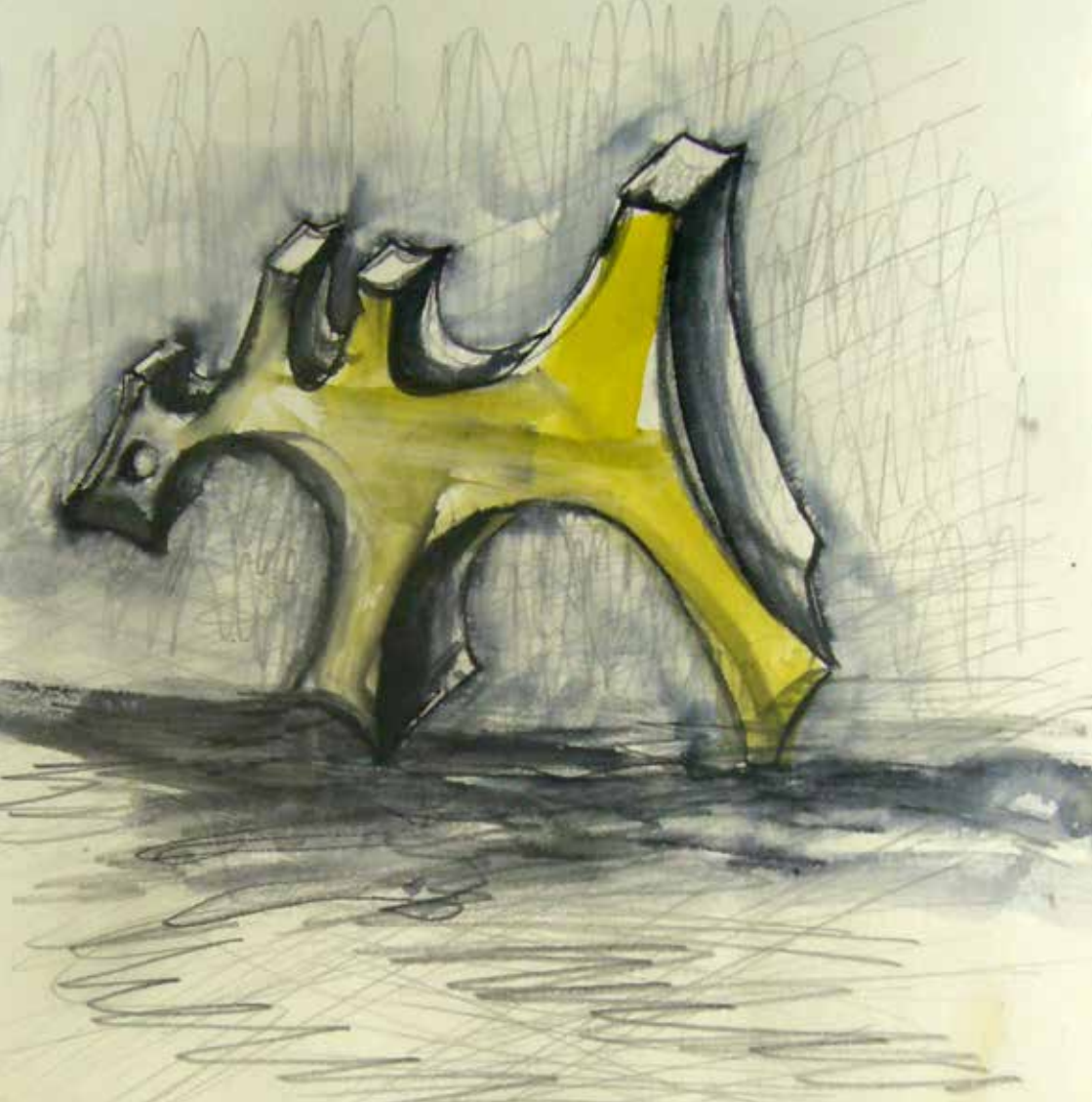
Mater Àgora Esperances Tinta i aquarel·la